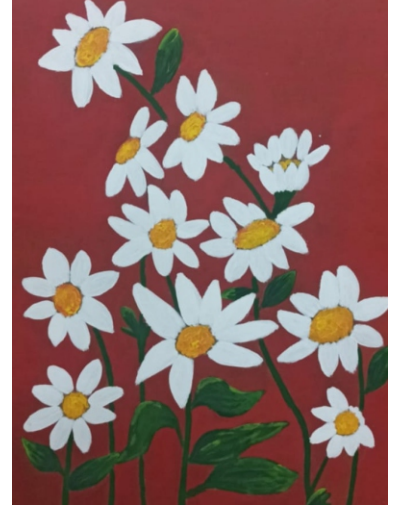
Hacer KESKİN [10-A]