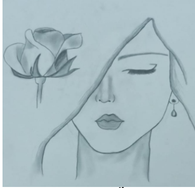
Ayfer Büşra KÖSE [7-A]