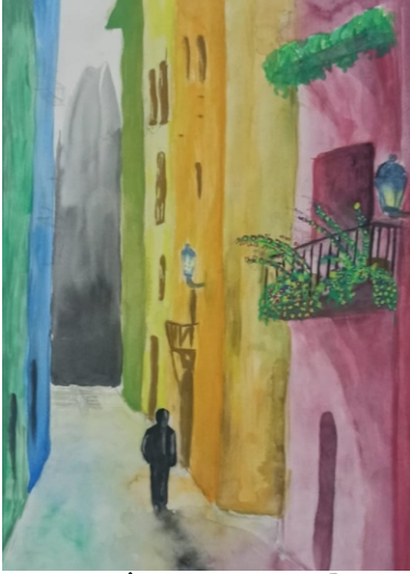
Fatma Zehra AKÇAY [10-B]