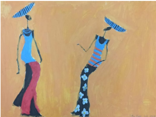
Elifsu AKTAŞ [6-A]