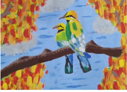
Elif Nur ÜZER [5-B]