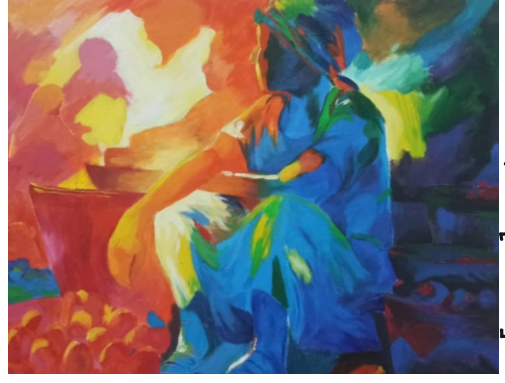
Tüzün UYGUN [10-A]