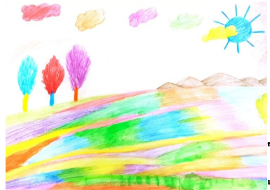
Ahmet DİKMEN [6-D]